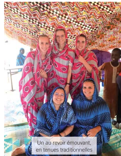
Un au revoir émouvant, en tenues traditionnelles

✳ Une telle expérience apprend à mener un projet en se fixant des objectifs, à construire un budget et à le respecter. Cela sera forcément utile dans ma future vie d'ingénieur.