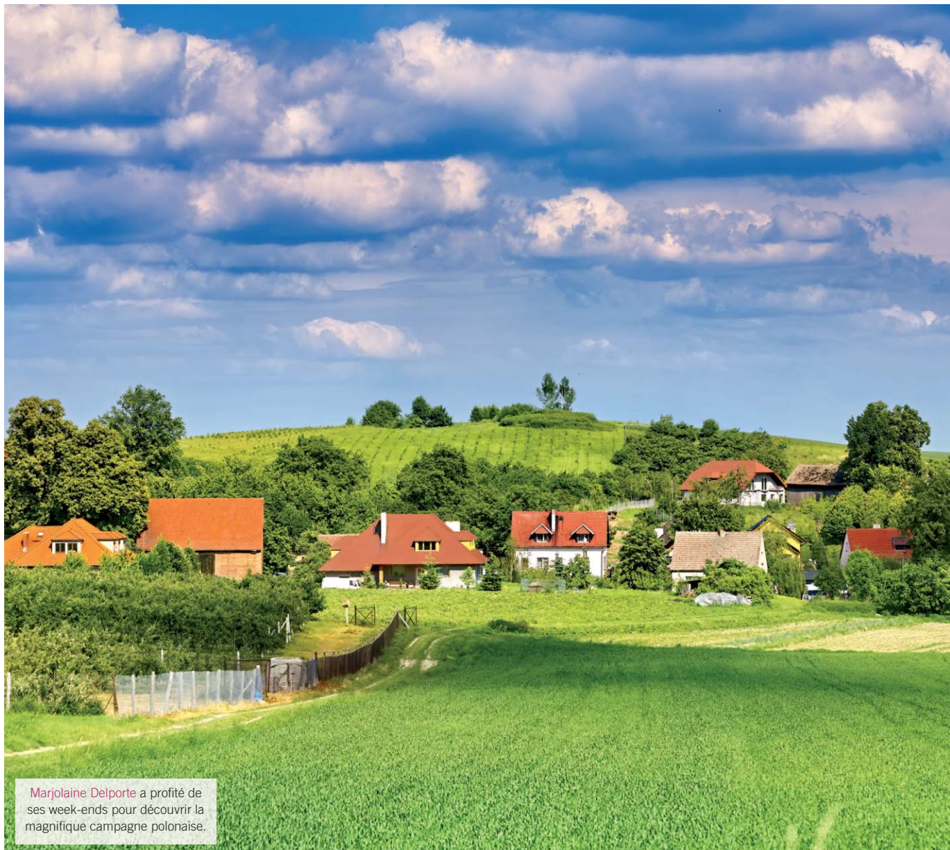
Marjolaine Delporte a profité de ses week-ends pour découvrir la magnifique campagne polonaise.

“ Marjolaine Delporte (2019) Ingénieur Méthodes Junior - Provost