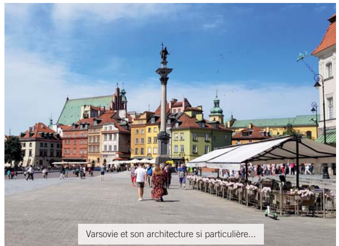
Varsovie et son architecture si particulière...

Ma mission a pris du retard en raison d'une chute imprévue de la production. Après quelques semaines à m'occuper en prêtant main forte à d'autres services, je me suis posée la question de savoir s'il valait mieux rentrer en France mais tout s'est finalement débloqué et j'ai