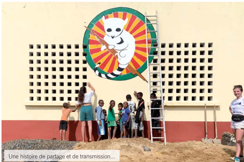
Une histoire de partage et de transmission...