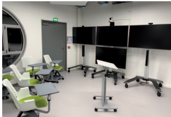
Le Teaching Center de Junia compte 3 studios d'enregistrement professionnel, sur une surface de 200m 2 .