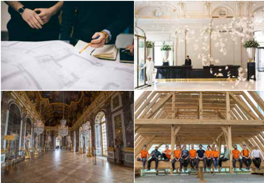
Le talent au service du temps

Restaurer le patrimoine historique et réaliser les projets d'exception d'aujourd'hui et de demain, avec des matériaux nobles et durables, en pérennisant, de génération en génération, les savoir-faire d'excellence, telle est la raison d'être du groupe Ateliers De France.